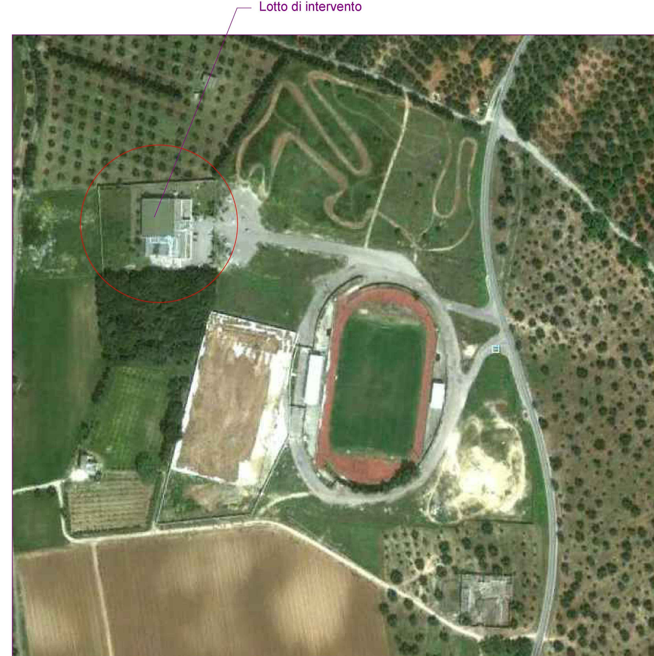
Stralcio da ortofoto - Scala 1:1.000