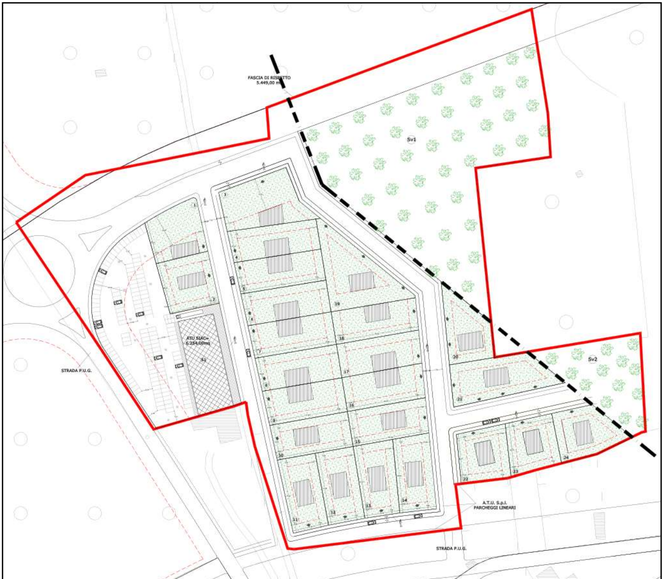
Figura 3 – Planimetria generale variante PUE (rif. Tav. 004 Progetto 2020)

La presente nota integrativa viene trasmessa a codesta Autorità Competente per la relativa trasmissione agli Enti nell'ambito della relativa Conferenza dei Servizi.